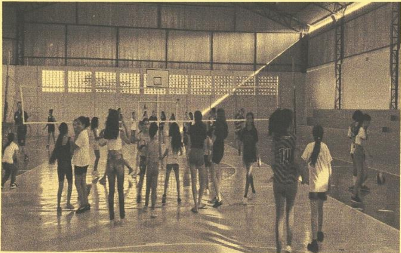
INÍCIO DOS TRABALHOS NO SANTA RITA