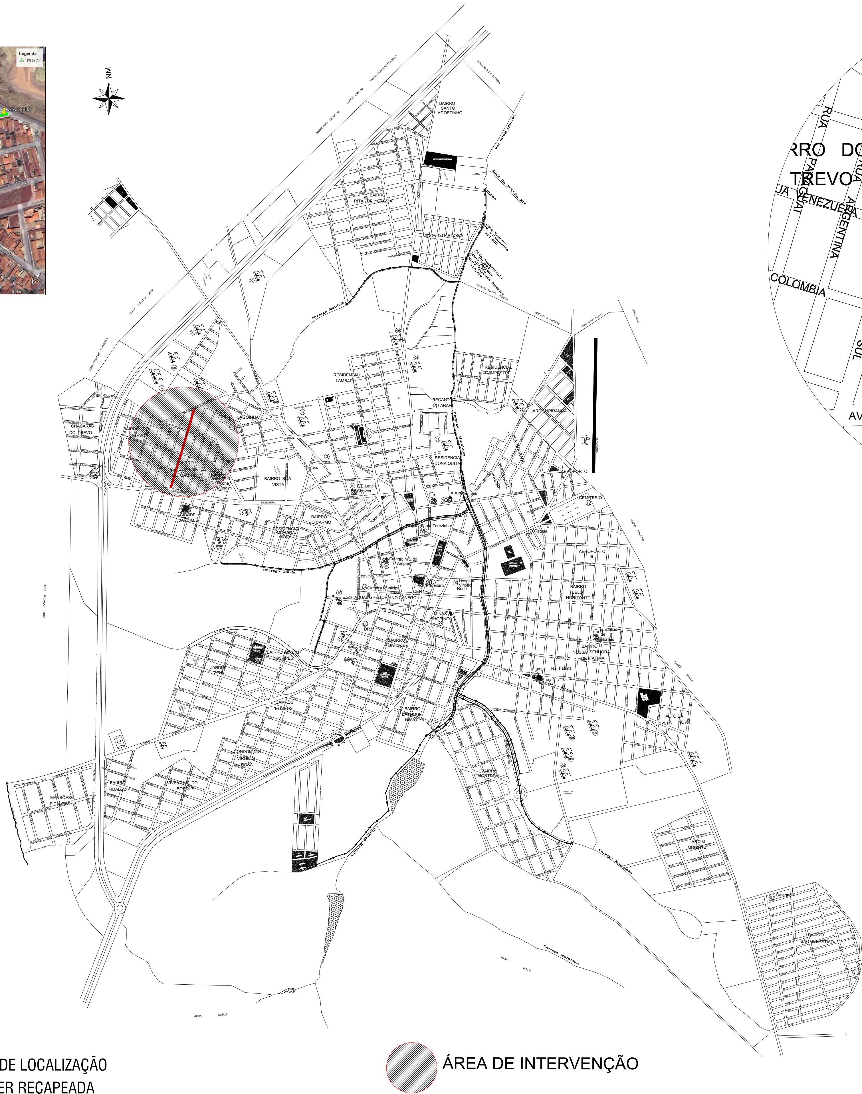
PLANTA DE LOCALIZAÇÃO RUA A SER RECAPEADA SEM ESCALA